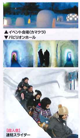
▲イベント会場(カマクラ) ▼パビリオンホール